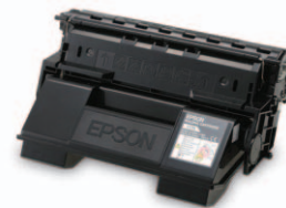
Fixačná jednotka na údržbu C13S053038BA